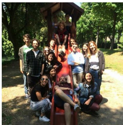
(gruppo Servizio Civile a.2017-2018)

La formazione rappresenta l'aspetto qualificante del progetto . La Caritas intende valorizzare la dimensione comunitaria dell'esperienza, proponendo forti esperienze di gruppo e l'opportunità di convivenza con gli altri volontari, in un appartamento ubicato sopra la sede del Centro di Ascolto.