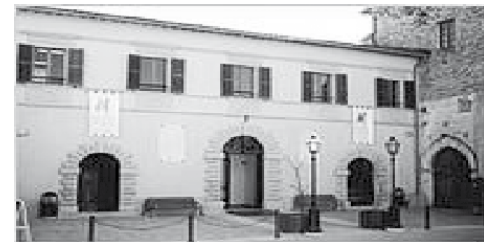
L'entrata del Museo di Pergola