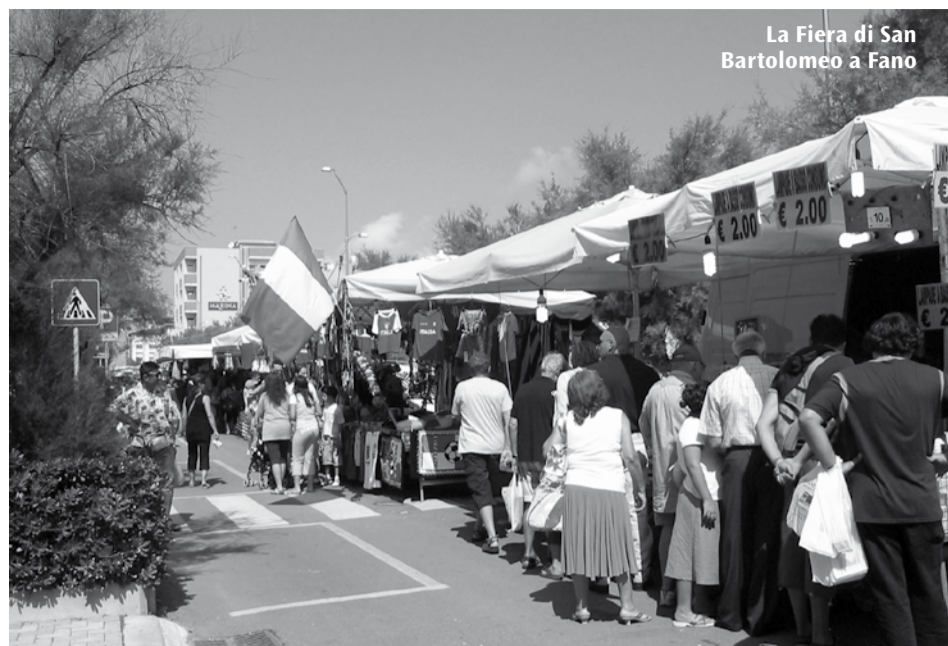
La Fiera di San Bartolomeo a Fano

particolare al "teatro im/possibile in tv" dell'attore/autore Marco Paolini, vero fenomeno di audience televisiva con i suoi spettacoli teatrali dal "Vajont" al "Sergente". Giovedì 7 agosto , dalle ore 20 nel centro storico di Fano, torna il tradizionale appuntamento con la sagra gastronomica "Quattro cantoni" . A Carignano, domenica 10 agosto dalle ore 16, è in programma la 6 a edizione della "Festa degli spaventapasseri" con stand gastronomici, musica, ballo e mercatino artigianale. Martedì 12, 19 e 26 agosto , all'anfiteatro Rastatt, l'Associazione dei cittadini Senegalesi di Fano, in collaborazione con il CRASM, l'Associazione "Mille voci", l'Assessorato alla Cultura del Comune, A.COLATA. Ass. Albanesi Illirinet Pesaro-Urbino, Mille Culture & una Città, organizza la festa culturale e tradizionale . Mercoledì 13 agosto , lungo Borgo Cavour a Fano, torna la sagra gastronomica "Festa del Borgo" . Da giovedì 21 a domenica 24 agosto , a