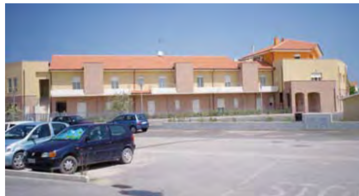
La facciata del Centro Residenziale San Francesco di Marotta

MAROTTA – La vita, che ormai ha sempre maggiori prospettive di prolungarsi negli anni, non è sempre sinonimo di salute, da qui la ricerca di strutture di accoglienza. A Marotta di Fano il 3 luglio scorso ha avuto inizio l'attività del "Centro Residenziale San Francesco", una nuova occasione offerta a chi si trova in necessità di trovare aiuto ai problemi della vita quando da soli non si è capaci di risolverli. Il tutto è cominciato quando la società proprietaria del terreno si è posta l'interrogativo se costruire appartamenti oppure un complesso a servizio di anziani ed è prevalsa la seconda ipotesi dal momento che le Suore Francescane dell'Addolorata di Mondavio insieme ad altre persone si sono costituite in società per dare vita e gestire quello che ormai è davvero un'ottima casa di accoglienza per persone anziane o inabili. Il Centro, che sorge in via Luigi Illica nei pressi della Farmacia Comunale di Marotta, accoglie persone autosufficienti o non autosufficienti in camere singole o doppie per una capacità di 60 posti letto. Ai quali vanno aggiunti 6 miniappartamenti destinati a due persone, con cucina, giardinetto indipendente ed ingresso autonomo, collegati alla struttura maggiore dalla quale possono ricevere assistenza infermieristica di cui dispone in modo permanente il Centro Residenziale. L'assistenza degli ospiti è infatti garantita